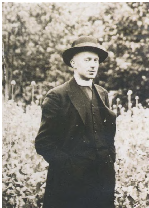
Błogosławiony Ksiądz Marian Konopiński