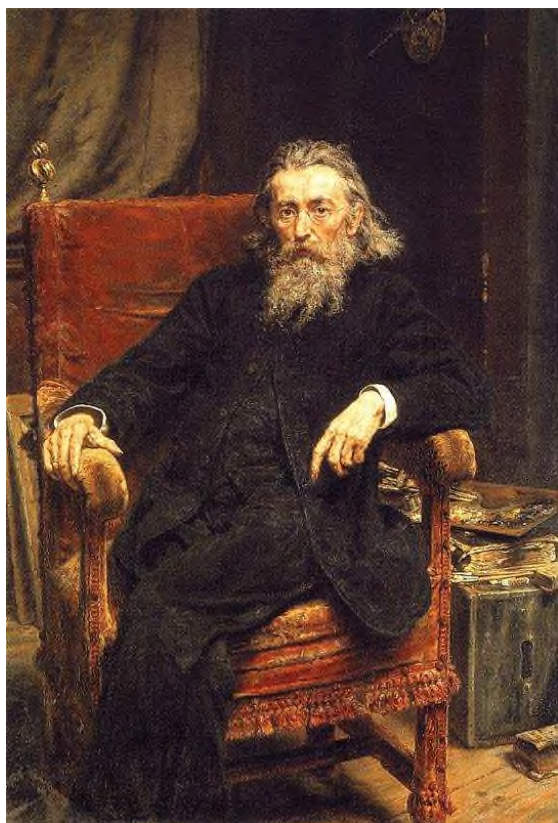
Jan Matejko (1838-1893)

Autoportret, 1892, olej, płótno, 160 x 110 cm. Muzeum Narodowe w Warszawie