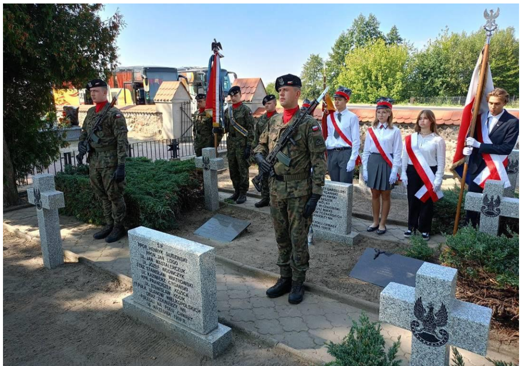
Na cmentarzu w Bielawach przy grobie Pułkownika; poczet sztandarowy Ułanów Poznańskich i zaprzyjaźnionych szkół

Po nawiedzeniu miejsca wiecznego spoczynku Dowódcy oraz ułanów w kwaterze wojennej cmentarza parafialnego w Bielawach, oddaniu hołdu przed pomnikiem 17. P. Uł. Wlkp. w Wałewicach, o godz. 14:30 w kościele parafialnym w Bielawach celebrowana była Msza Święta. Przed powrotem do Poznania, w miejscowej remizie zgotowano nam ucztę z fantastyczną grochówką i przepyszным ciastem. Podziękowaniom nie było końca. Wróciliśmy tuż po godz. 20:00.