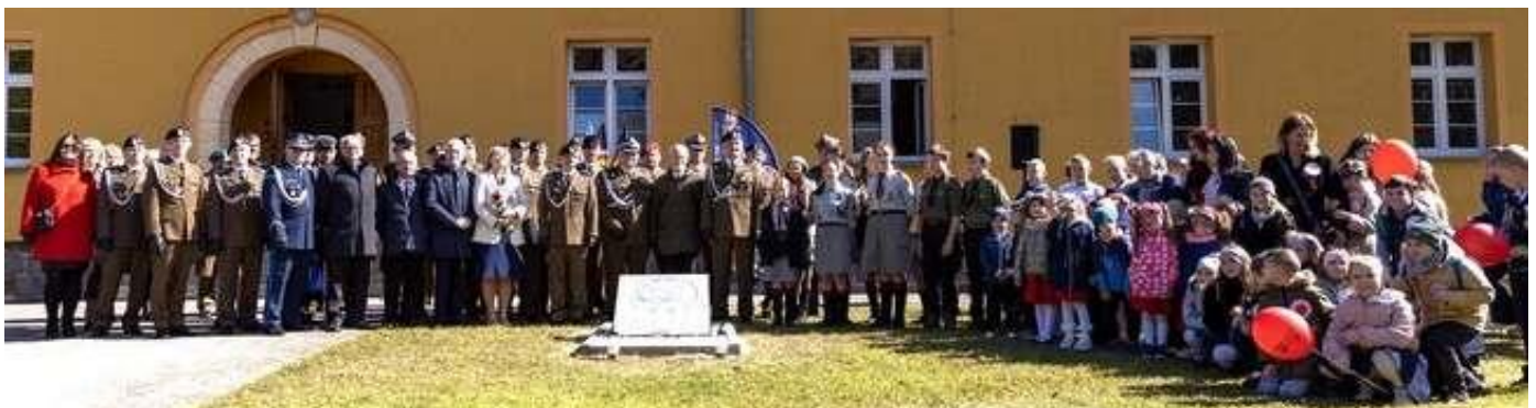
Zapalenie zniczy i złożenie pokłonu przed nowo odsłoniętą tablicą ku chwale Kawalerii i Artylerii Konnej

Tekst: Tadeusz Pawlicki