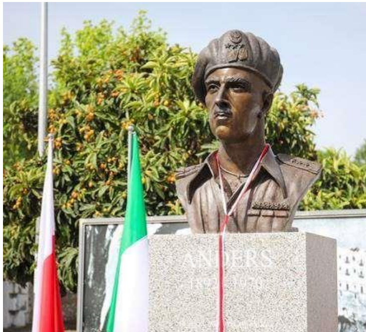
Popiersie dowódcy 2. Korpusu Polskiego na Largo Generale Anders w Cassino

Wykonane z brązu popiersie dowódcy 2. Korpusu Polskiego odsłonięte zostało 17 maja 2014 r. w Cassino na placu jego imienia, a ufundowane przez Stowarzyszenie Weteranów Armii Polskiej w Ameryce (SWAP). Ma ono metr wysokości, stoi na prawie dwumetrowym granitowym piedestale. Autorem projektu był mieszkający w USA rzeźbiarz Andrzej Pityński (1947–2020); autor m.in. Pomnika Katyńskiego w Jersey City. Monument w Cassino jest zmodyfikowaną kopią pomnika generała Andersa, który stoi na weterańskim cmentarzu w amerykańskiej Częstochowie (Doylestown, PA). Inna kopia tego pomnika znajduje się w National Army Museum w Londynie.