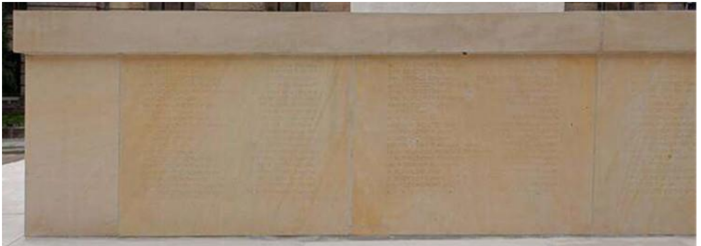
Fragment cokołu Pomnika z wykutymi nazwiskami poległych i zmarłych podczas działań wojennych ułanów