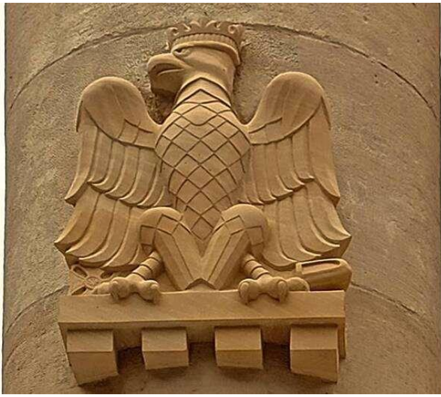
Orzeł wykuty przez p. Marka Zielonkę w bryle 700 kilogramowego piaskowca