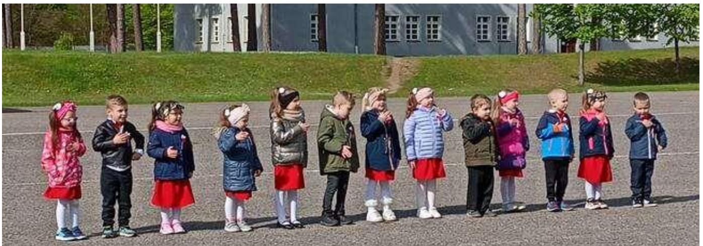
Przedszkolaki rozczulająco śpiewają piosenkę „Bo ja jestem Polak mały, taki silny, taki śmiały...”