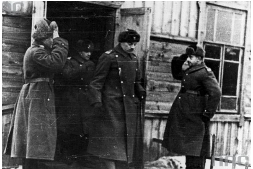
Gen. Władysław Anders dokonuje inspekcji oddziałów Armii Polskiej w ZSRR.