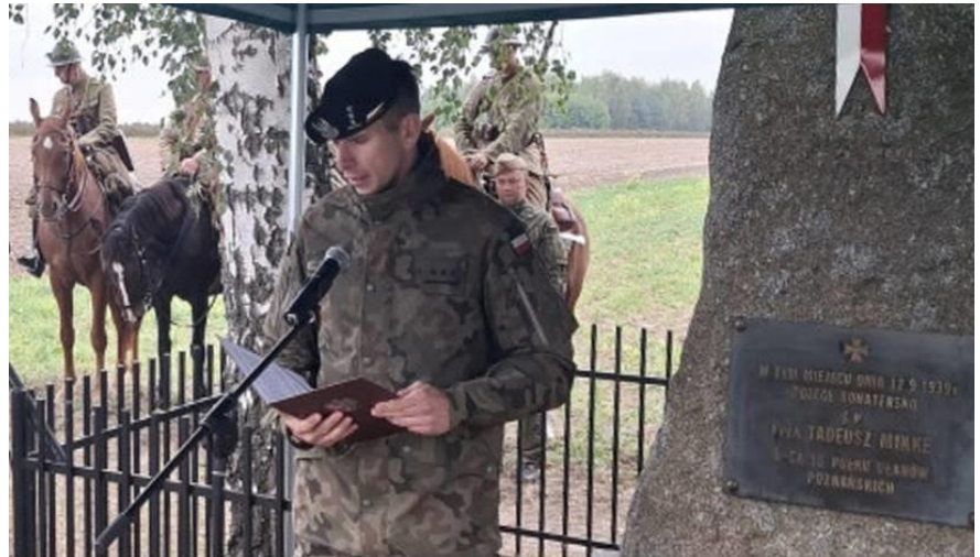
Poczet Sztandarowy 15. batalionu Ułanów Poznańskich i odczytanie listu dowódcy