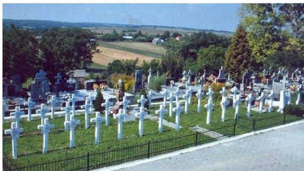
Cmentarz w Komarowie pow. Zamość