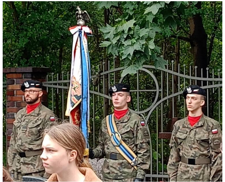
Poczet sztandarowy 15. batalionu Ułanów Poznańskich z Wędrzyna