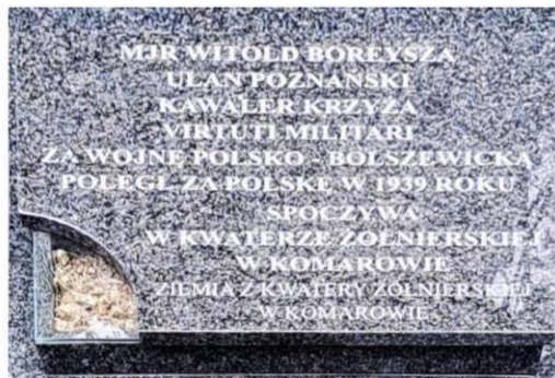
Cmentarz w Poznaniu przy ul. Lutyckiej