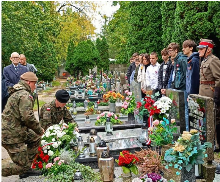
Kwiaty i znicze składa delegacja 12. Wielkopolskiej Brygady Obrony Terytorialnej